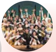
キャスト 劇団 ティンカーベル